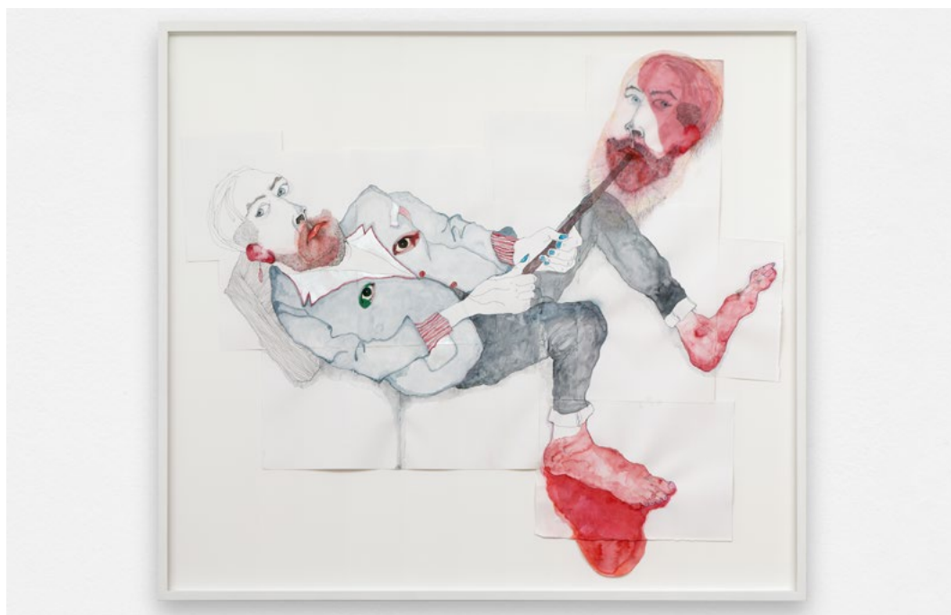
En haut : Histoires vraies , MAC VAL Musée d'art contemporain du Val-de-Marne, photo : Martin Argyroglo. En bas : Marie Losier, Da Da Da (David Legrand), 2023, aquarelle et crayon sur papier aquarelle, 79 x 89,5 cm / 86 x 97 cm avec cadre, photo : Aurélien Mole, courtesy galerie anne barrault.