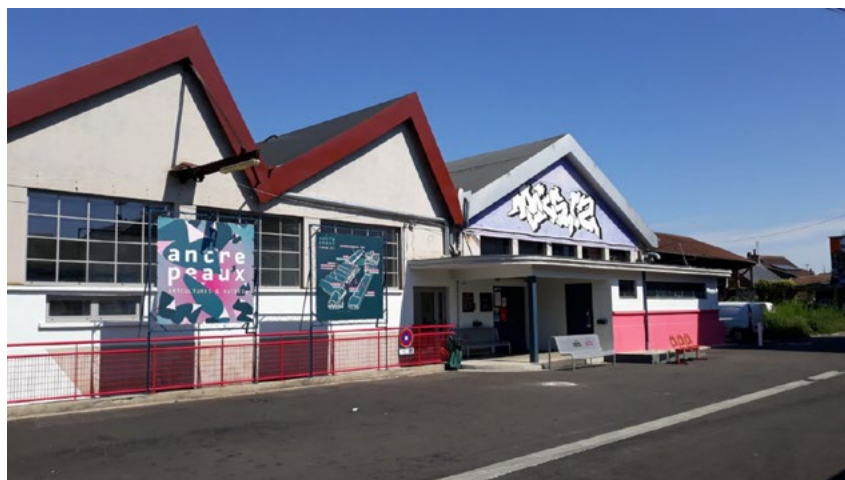
Le centre d'art Transpalette au sein de la friche de l'Antre peaux à Bourges.

Depuis 2017, sa programmation fait l'objet d'un compagnonnage avec la commissaire Julie Crenn. Antre Peaux est soutenu par la DRAC Centre-Val de Loire, la Région Centre-Val de Loire, le département du Cher et la ville de Bourges. Plusieurs projets sont soutenus par la Commission européenne.