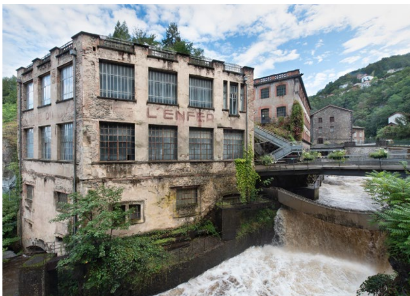
L'Usine du Creux de l'Enfer, fermée temporairement pour travaux.

Depuis 2021, le Creux de l'Enfer a pris place dans un bâtiment voisin, l'Usine du May, qui met notamment en valeur des projets en lien étroit avec des acteurs du territoire. Un nouvel espace d'accueil ainsi qu'une boutique y ont été réalisés sur-mesure par le designer Christophe Dubois. L'usine du Creux de l'Enfer, actuellement en travaux, rouvrira ses portes en 2025, pour révéler un centre d'art contemporain déployé sur deux usines.