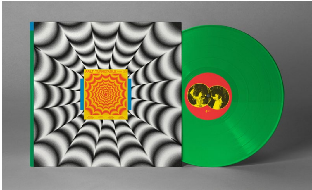
Disque vinyle de l'album Turnetable du duo Arlt, Objet Disque, 2022.