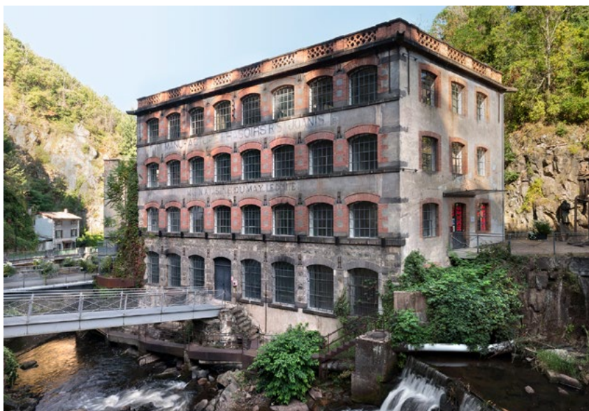
L'Usine du May, un nouvel espace pour le centre d'art.